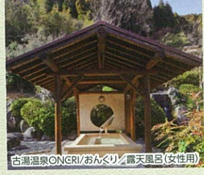
古湯温泉ONCRI/おんくろ / 露天風呂(女性用)