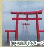
海中鳥居(イメージ)★