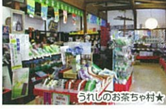
うれしのお茶ちや村★