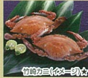
竹崎カニ(イメージ)★