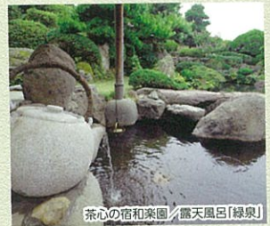
茶心の宿和楽園 / 露天風呂「緑泉」