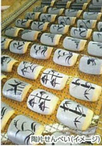
陶片せんべい(イメージ)

伝統的な焼き物のひとつ「唐津焼」。その唐津焼をモチーフにしたせんべい。新たな唐津名物としても注目されています。