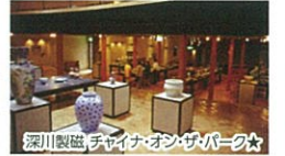
深川製磁 チャイナ・オン・ザ・パーク★

深川製磁の商品を購入できるのももちろん、深川様式のメモリアルコレクションをご鑑賞いただけます。現在も国内外で愛される作品を作り続けている深川製磁が運営する陶磁器のテーマパークです。