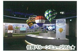
佐賀バルーンミュージアム★

国内初の常設型バルーンミュージアム。佐賀インターナショナルバルーンフェスタで撮影された臨場感あふれるバルーン映像を楽しむ大型シアタールームや、パイロット気分を味わえるバルーンフライトシミュレーター、バルーンの歴史に関する展示等をしています。