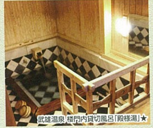
武雄温泉 楼門内貸切風呂「殿様湯」★