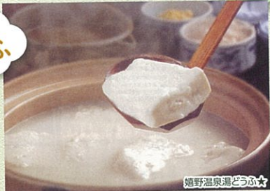
嬉野温泉湯どうふ★

嬉野の温泉水で煮込むと、あら不思議! 煮汁が豆乳色に変わり、とろとろの豆腐に仕上がります。その食感と味わいはやみつきになります。