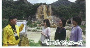
有田が尔(イメージ)

有田焼の原料となる陶石の採掘場。現在、採掘はほとんど行われていませんが、掘り続けられた山の姿は奇観です。エースJTBでは、ガイドのご案内するプランもご用意しております。