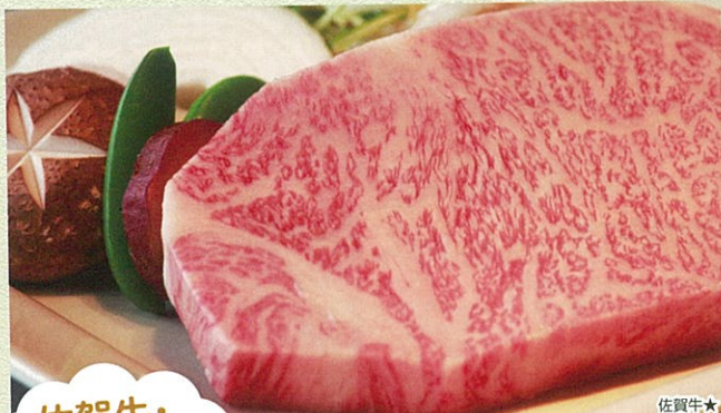
佐賀牛・伊万里牛