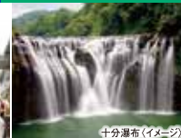
十分瀑布(イメージ)