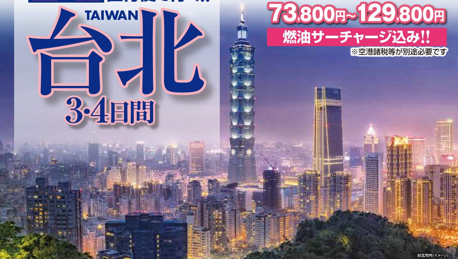
台北市内(イメージ)

■発着地 / 阿蘇くまもと空港 ■利用予定航空会社 / チャイナエアライン ■出発期間 / 2025年10月2日～2026年3月29日 ■最少催行人員 / 1名様 ※ただし1名参加の場合、1人部屋追加代金(泊数分)が別途かかります ■添乗員 / 同行しませんが現地係員がご案内いたします ■食事条件 (機内食を除く) / ●3日間:朝食2回 ●4日間:朝食3回 (ご注意) ●シティホテルタイプの朝食はすべてBOX形式でご提供となります。 ■パスポート残存期間 / 日本国籍の方で台湾滞在期間中(帰国時まで)有効なものが必要ですが ※但し、出国時90日以上のもので望ましい ※パスポート有効残存期間は予告なしに変更 となる場合がございます。最新の情報を必ずご確認ください。