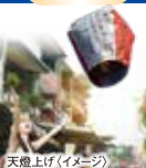
天燈上げ(イメージ)

ホテルへお出迎え (7:00～8:00頃) ※台北駅集合希望のお客様は台北駅東一門にて08:00集合となります。～十分瀑布、つり橋、奇岩などを見学～十分に天燈上げ体験 (1～4名に1つ)～その後、平溪線ローカル列車にて瑞芳へ。着後、混乗車にて九份へ～(昼食) 九份にて郷土料理～昼食後、九份観光 (悲情城市～昇平戲院)～混乗車にて台北市内へ～台北101にて解散 (16:00～16:30頃) (ご注意) ●天燈上げ体験料金を含みますが、天候により体験ができない場合もございます。(返金不可) ●週末・祝日など、九份では交通規制のため路線バスに乗り換えてご案内する場合がございます。