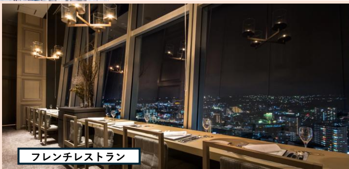
フレンチレストラン