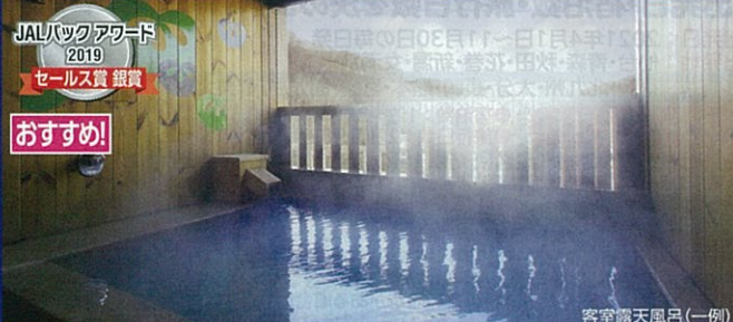
客室露天風呂(一例)