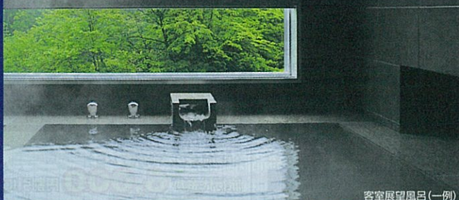
客室展望風呂(一例)