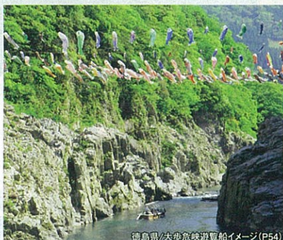
徳島県/大歩危滝遊覧船イメージ(P54)