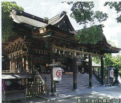
香川県/金刀比羅宮(P54)