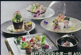
瀬戸内の旬彩会席一例 A55