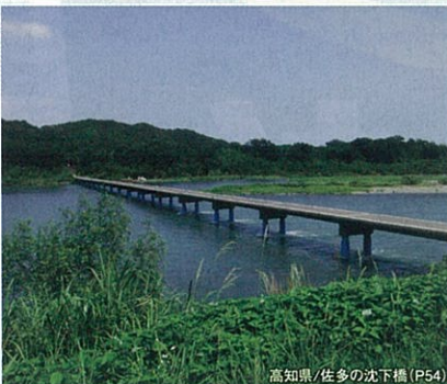
高知県/佐多の沈下橋(P54)