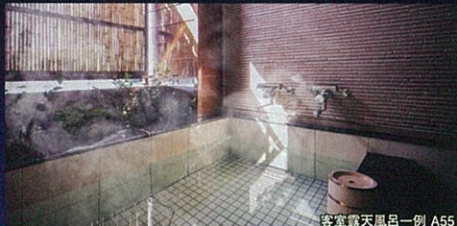
客室露天風呂一例 A55

全客室、温泉露天風呂付の宿。お食事もお部屋の食事部屋でお楽しみいただけます。静かにゆっくりと過ごしたいお客様におすすめです。