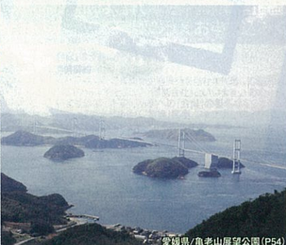
愛媛県/亀老山展望公園(P54)