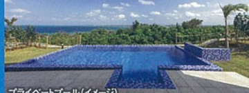
プライベートプール(イメージ)