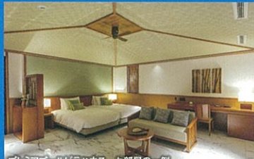
プレミアプールビラハウス お部屋の一例

プライベートプール付きのビラハウスはオールスイートルームです。建物面積73㎡(プールを含む敷地面積149㎡~311㎡)と余裕の広さで、オリエンタルで南国ムードが漂う様々なタイプの客室をご用意しております。