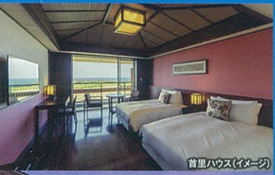
首里ハウス(イメージ)

ホテル棟タイプの「首里ハウス」は、全62室。どの客室にも完備のゆったりとしたバスルームが好評です。