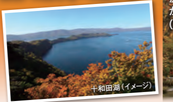
十和田湖(イメージ)

樹海ラインの終点、発荷(はっか)峠展望台から十和田湖の外輪山を眺望できます。(例年の見頃: 10月中旬~10月下旬)