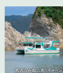
宮古うみねこ丸(イメージ)