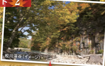
松川渓谷(イメージ)

八幡平国立公園に位置する紅葉スポット。色とりどりの落葉樹の紅葉が人気です。(例年の見頃: 10月中旬~10月下旬)