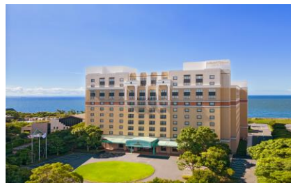
※画像すべてイメージです