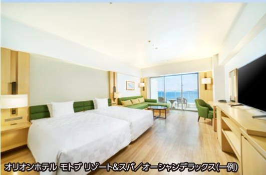
オリオンホテル モトブリゾート&スパ/オーシャンデラックス(一例)