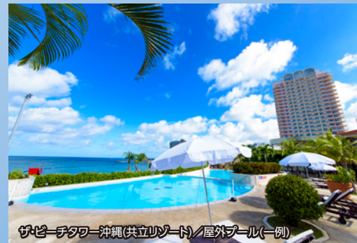
ザビエータワ-沖縄(共立リゾート)/屋外プール(一例)