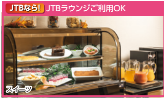
JTBなら! JTBラウンジご利用OK