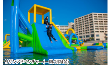
リザンシアドベンチャー(一例/別料金)