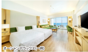
オーシャンデラックス(一例)