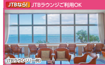
JTBなら! JTBラウンジご利用OK