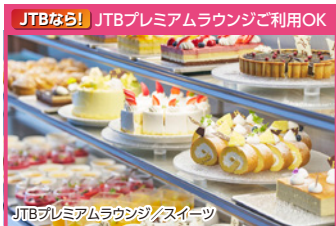
JTBなら! JTBプレミアムラウンジご利用OK