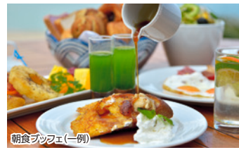
朝食ブッフェ(一例)