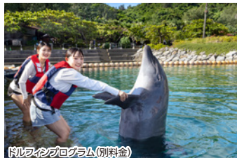
ドルフィンプログラム(別料金)