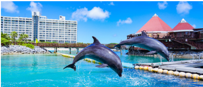
外観&ドルフィンプログラムの一例(別料金)

マリンスポーツ、ドルフィンプログラム、お子様向けお仕事体験など多彩なアクティビティをお楽しみいただけます。(別料金)ファミリーや3世代におすすめです。