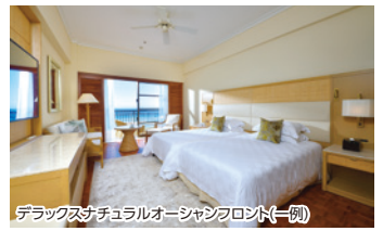
デラックスナチュラルオーシャンフロント(一例)