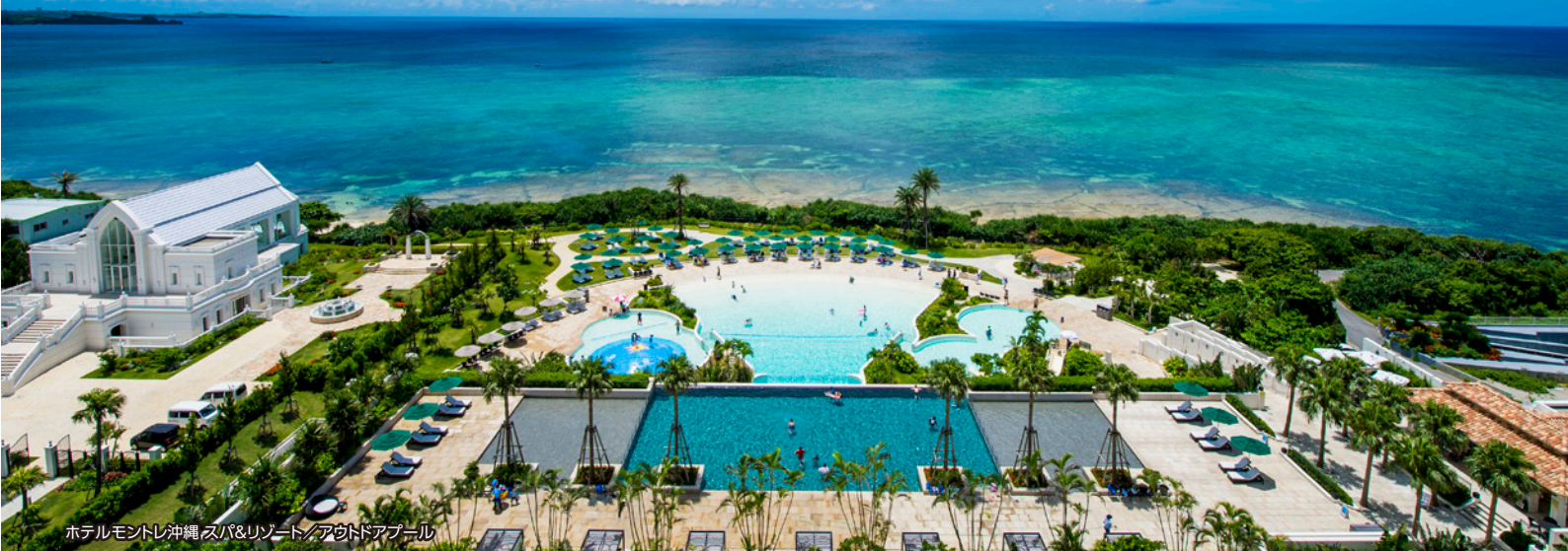
ホテルモンテ沖縄 スパ&リゾート/アウトドアプール