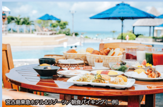
宮古島東急ホテル&リゾート/朝食バイキング(二例)