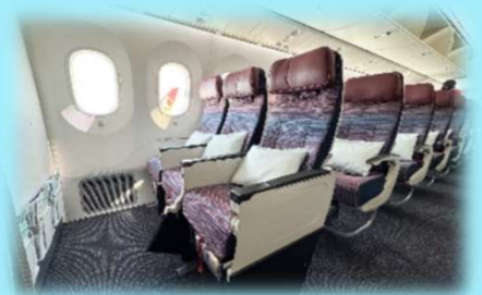
大韓航空エコノミークラス (イメージ)

大韓航空エコノミークラス利用/福岡発/ハワイ5日間/アクアバームス/ (2名1室利用/大人/お一人様)